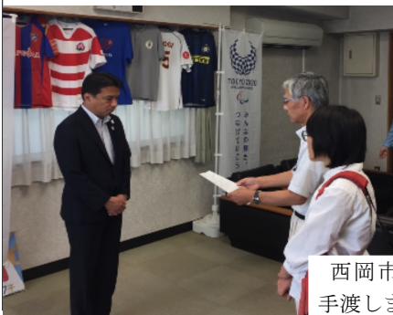
西岡市長への申し入れ書を手渡しました（9月25日）