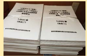
小池都知事に提出した要請書

西岡市長への「計画見直し」要請行動◆都議会全会派を訪問、市議会会派への「会報」届けと協力要請◆市議選・都議選の立候補者への公開アンケート実施