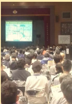
都建設局主催の3・4・11号線説明会(2018年3月)